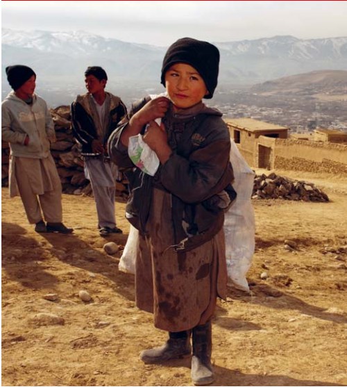
Fayzabad, Afghanistan: Arme Familien brauchen Verdienstmöglichkeiten, damit sie ihre Kinder zur Schule schicken können.